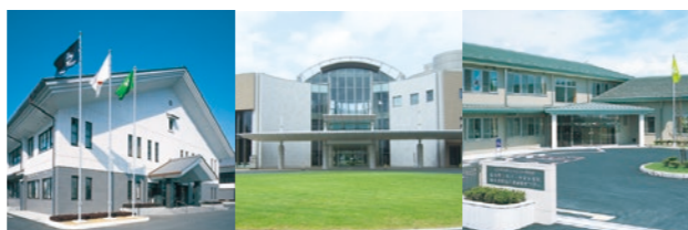
南校 中央校 北校